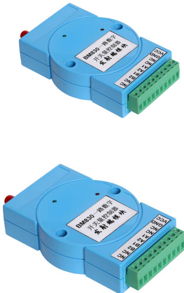
图一: BM830 产品实物图