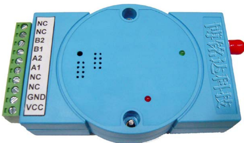
图一: BM830 外型示意图